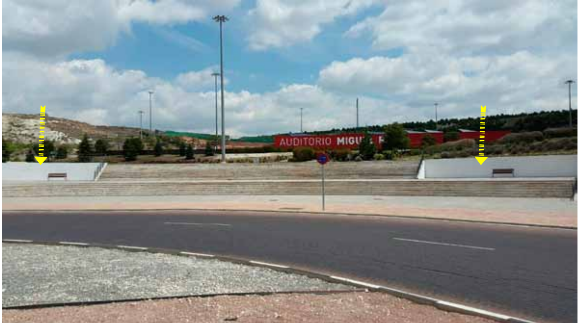
Murales: paredes laterales y acceso al recinto ferial por la avda. Aurelio Álvarez.