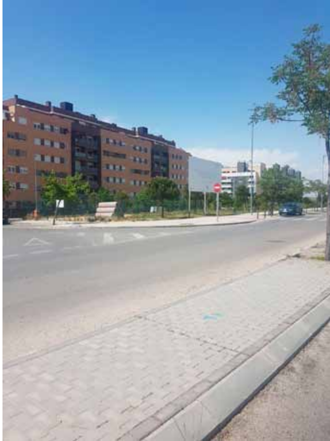
Valla avenida de la Tierra con calle de Trece Rosas