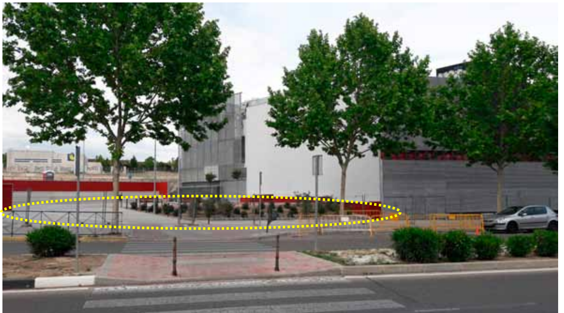
Intervención artística: instalación en el entorno de la Biblioteca Central, avda. Pablo Iglesias con la temática del libro o lectura como motivo a desarrollar. (No murales)